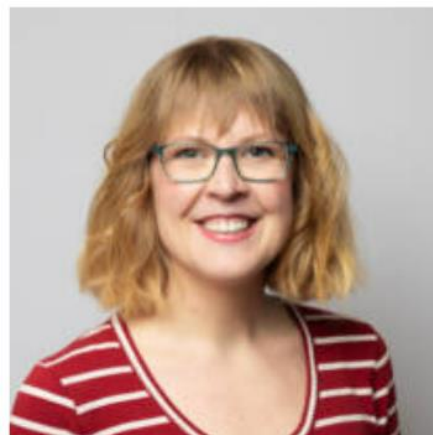
Okariina Rauta Motiva Oy