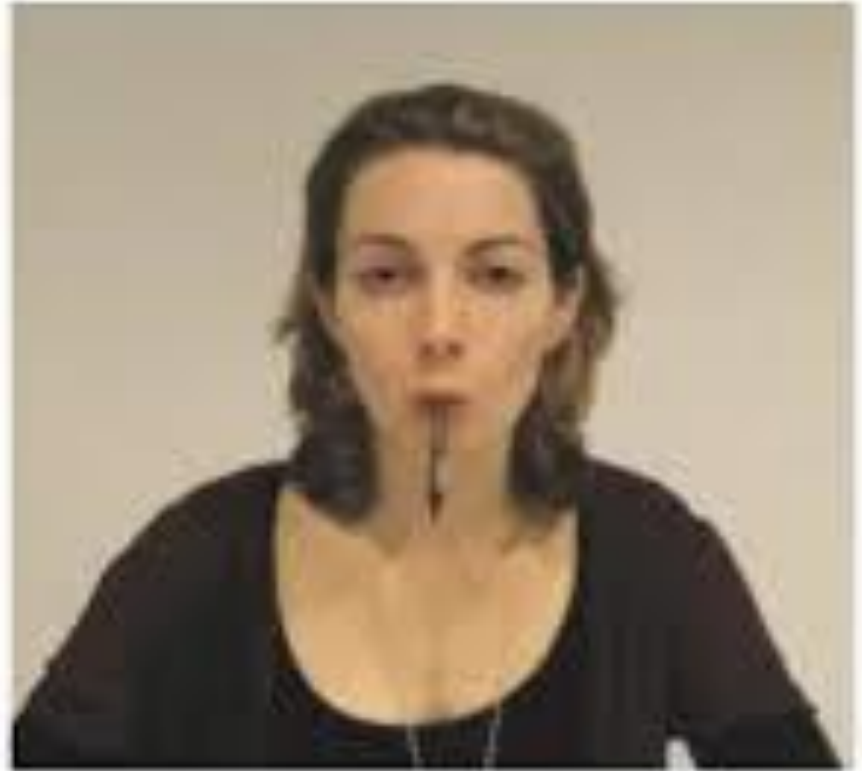
Image via questle.com and ofline showing how participants were instructed to hold the pen